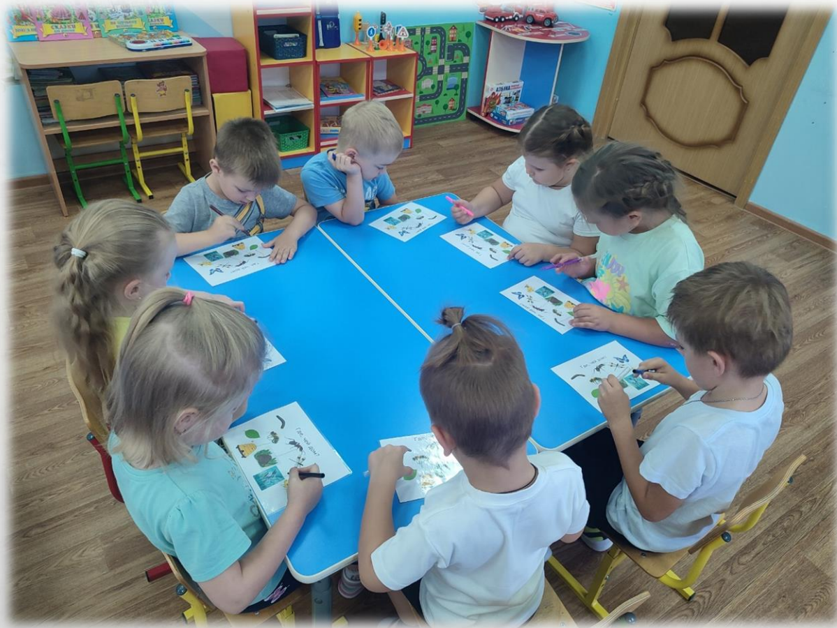
Д/И «Где чей домик»